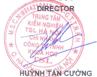
HUỖNH TÂN CƯỜNG